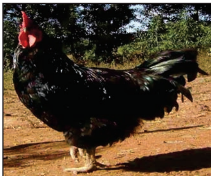
Figura 03: Ave Gigante Negro