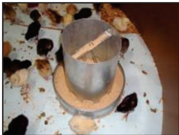
Figura 22: Comedouro tubular infantil