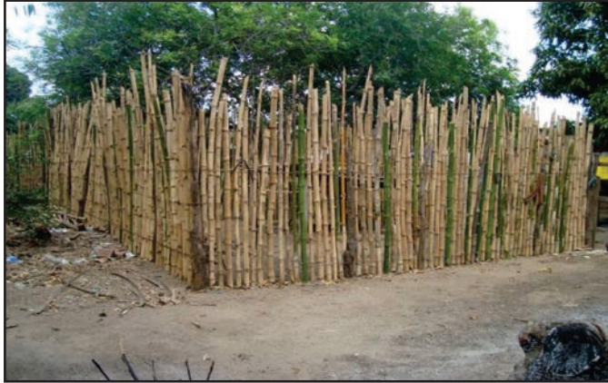
Figura 13: Cerca construída com bambu.

No sistema semi-intensivo de criação a área de pastejo é fundamental para que as aves sejam soltas, conferindo-lhes uma condição de liberdade, tendo acesso ao ar fresco, luz diurna natural, área para repouso sombreada, água e alimento, proporcionando assim um ambiente sadio.