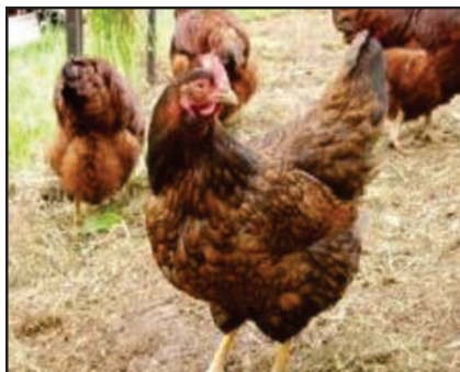
Figura 07: Aves Rhode Island Red