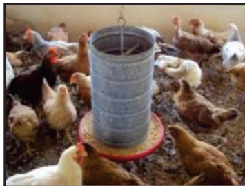
Figura 23: Comedouro tubular adulto