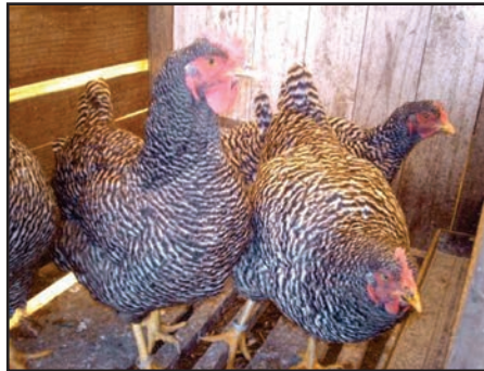
Figura 08: Aves Plymouth Rock Barrada (Carijó)