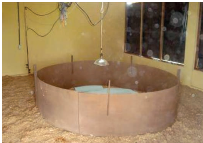
Figura 25: Círculo de proteção montado