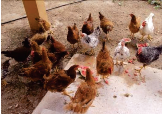
Figura 33: Aves adultas alimentando-se de melancias

guandu, leucena, algaroba, cunhã, etc. Reduzindo, dessa forma, os gastos com a aquisição de ração concentrada ou outros ingredientes. Além disso, devem-se fornecer alimentos verdes, com uso de capins nos cercados, frutas e hortaliças frescas. Na figura 33 podemos verificar as aves recebendo alimentação alternativa à base de melancia.