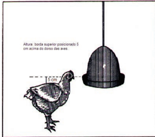
Figura 21: Altura correta do bebedouro