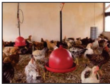
Figura 20: Bebedouro pendular