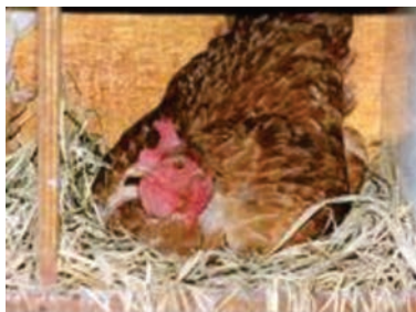
Figura 29: Ave acomodada no ninho