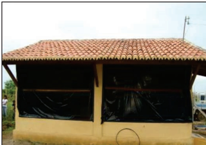
Figura 16: Galpão com lona de polietileno na lateral