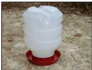
Figura 19: Bebedouro pressão

Os bebedouros podem ser confeccionados na propriedade, conforme a disponibilidade de material e da criatividade do criador, bem como serem adquiridos modelos comerciais em casas especializadas.