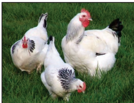
Figura 06: Aves Light Sussex