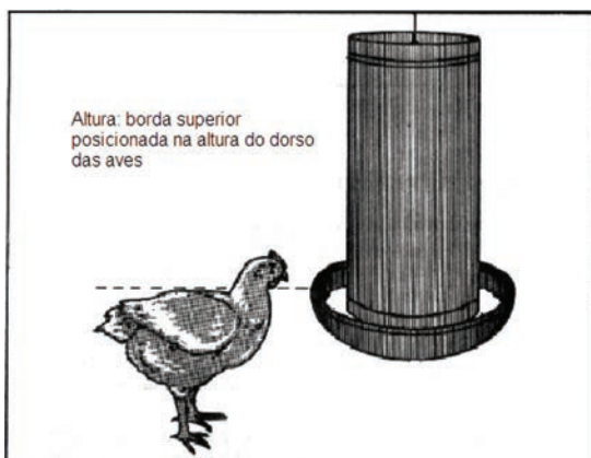
Figura 24: Altura correta do comedouro