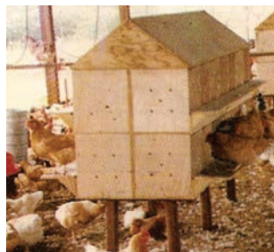
Figura 30: Bateria de ninhos

Os ninhos devem ser instalados no galpão quando as aves atingirem a idade de 16 a 18 semanas, sendo forrados (cama) com material limpo e seco que deverá de trocado com frequência, oferecendo o máximo possível de higiene.