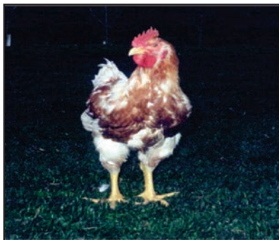
Figura 02: Ave Embrapa 041