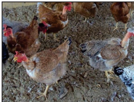
Figura 09: Aves Isa Label