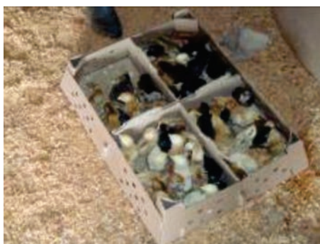
Figura 31: Caixa de papelão para transporte de pintos.