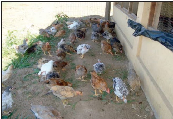
Figura 14: Aves pastejando próximo ao aviário (abrigo).

Como alternativa, o sistema de pastejo rotacionado pode ser adotado, pois nele, as aves terão acesso por certo período de tempo a diferentes piquetes (rodízio) com áreas reduzidas, dependendo da quantidade de aves e da quantidade e qualidade do pasto, evitando-se que ocorra o superpastejo ou a presença de áreas não pastejadas. Além dessas vantagens, a rotação entre piquetes, quando bem planejada e executada, torna-se uma importante ferramenta para o controle de endoparasitas (verminoses), pois no período de vazio para a recuperação do pasto, o parasita não encontra o seu hospedeiro intermediário (ave) para o completo desenvolvimento do seu ciclo de vida.