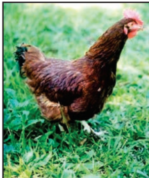
Figura 05: Ave Embrapa 051