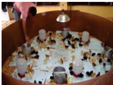
Figura 26: Campânula instalada

Existem no mercado vários modelos de campânulas: elétricas, a lenha ou a gás. Nas figuras 26 e 27 são mostrados os pintinhos distribuídos dentro do círculo de proteção sob a fonte de calor e um modelo de campânula elétrica, respectivamente.