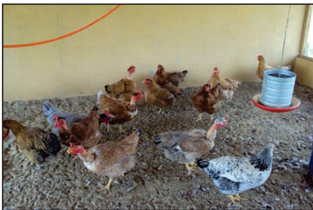
Figura 17: Cama de maravalha.

Ao final de cada ciclo a cama deverá ser totalmente removida do galpão, podendo ser utilizada, posteriormente, na elaboração de adubo (compostagem). A prática de fornecimento na forma de alimento aos animais ruminantes (bovinos, caprinos e ovinos) está proibida, pelo fato da comprovação dos seus efeitos na disseminação de doenças a esses animais. Com isso, o criador que desrespeitar a legislação poderá pagar multa e/ou ter seu estabelecimento interdito.