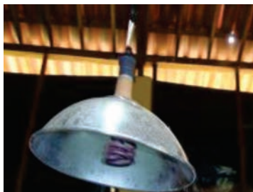
Figura 27: Campânula elétrica

O avicultor precisa estar atento ao comportamento dos pintos dentro do círculo de proteção para regular corretamente a altura da campânula. Os pintos devem estar uniformemente distribuídos dentro do círculo de proteção e alimentando-se com naturalidade. Aves amontoadas sob a campânula indicam temperatura baixa ou má distribuição dessa temperatura, podendo a campânula estar a uma altura elevada. Aves inertes ou ofegantes indicam excesso de temperatura, podendo a campânula estar muito baixa. Aves amontoadas em cantos do círculo podem indicar correntes de ar frio.