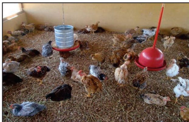
Figura 18: Cama de sabugo de milho triturado