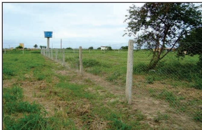
Figura 12: Cerca com tela de arame galvanizado e estacas de concreto.

Usado para delimitar a área de pastejo, impede que as aves invadam plantações ou propriedades vizinhas à procura de alimentos, além de dificultar a ocorrência de roubos. Pode ser construída com tela de arame galvanizado (malha 1 ou 2") ou polietileno, vara, bambu, pau a pique, etc., comumente em torno de 2,0m de altura. Nas figuras 12 e 13 são ilustradas as construções de cercados para pastejo (piquetes) com tela de arame galvanizado e bambu, respectivamente.