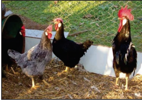
Figura 04: Aves Leghorn