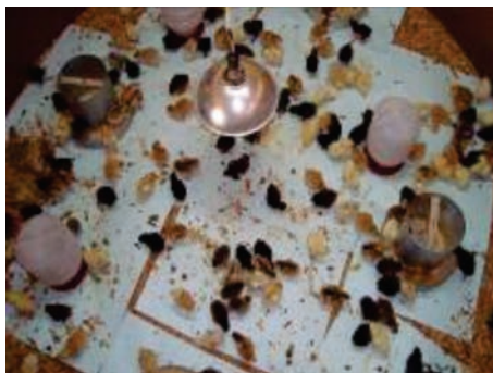
Figura 32: Pintos distribuídos no círculo de proteção.

Em seguida, fornecer através dos bebedouros, 50 gramas de açúcar por litro de água para aumento da energia e hidratação dos pintos. Para induzir o consumo da água com a solução, alguns pintos deverão ter os bicos imersos na água e soltos dentro do círculo de proteção (Figura 32). A temperatura ideal dentro do círculo deve ser entre 31 e 33°C.