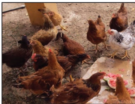
Figura 01: Aves paraíso pedrês