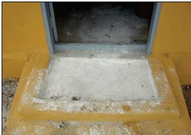
Figura 15: Pedilúvio

Tem a função de evitar a entrada de microorganismos patogênicos no galpão. Deve ser construído na entrada da instalação (figura 15), onde será colocada cal virgem, de forma que qualquer pessoa que entre ou saia, pise dentro do pedilúvio com a cal, evitando levar doenças de um galpão para outro.