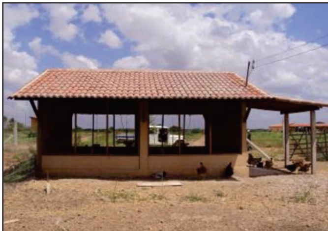
Figura 10: Galpão de alvenaria

A lateral do galpão não será totalmente fechada, para que haja renovação de ar entre o ambiente interno e externo, com pé-direito entre 2,50 e 2,80m de altura, fornecendo melhor ambiente às aves. Diante disso, faz-se necessário a construção de muretas laterais com altura de 30 a 50cm, nas quais serão fixadas as telas. As telas poderão ser confeccionadas com arame galvanizado ou polietileno e bitolas de \frac{1}{2} , 1 ou 2 polegadas, devendo serem instaladas até a altura do teto.